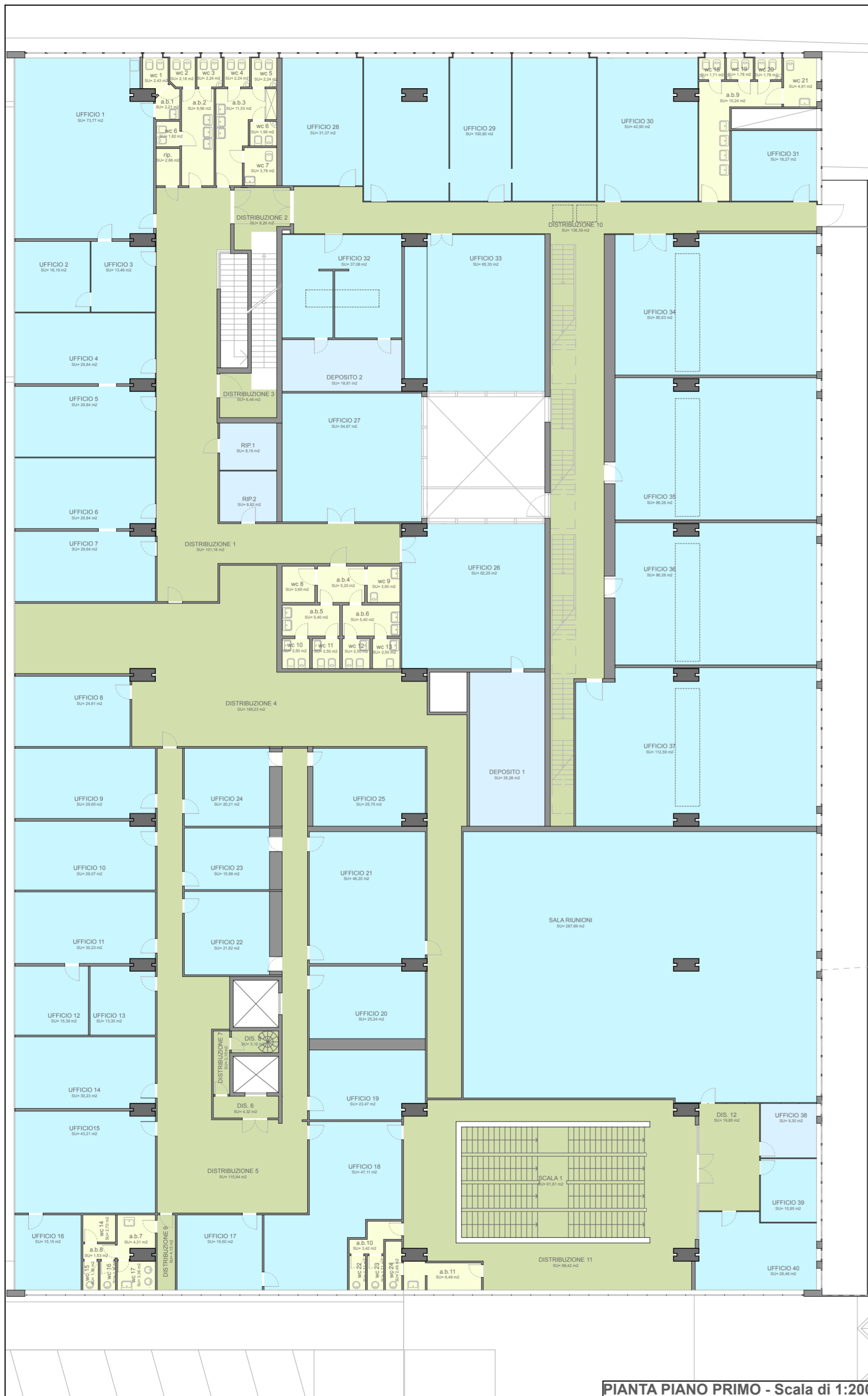
PIANTA PIANO PRIMO - Scala di 1:200